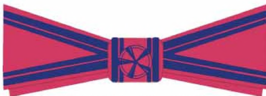
Fundă (papion) doamne ofițer