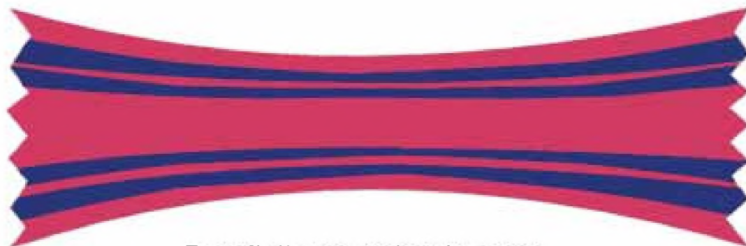
Panglică comandor de pace