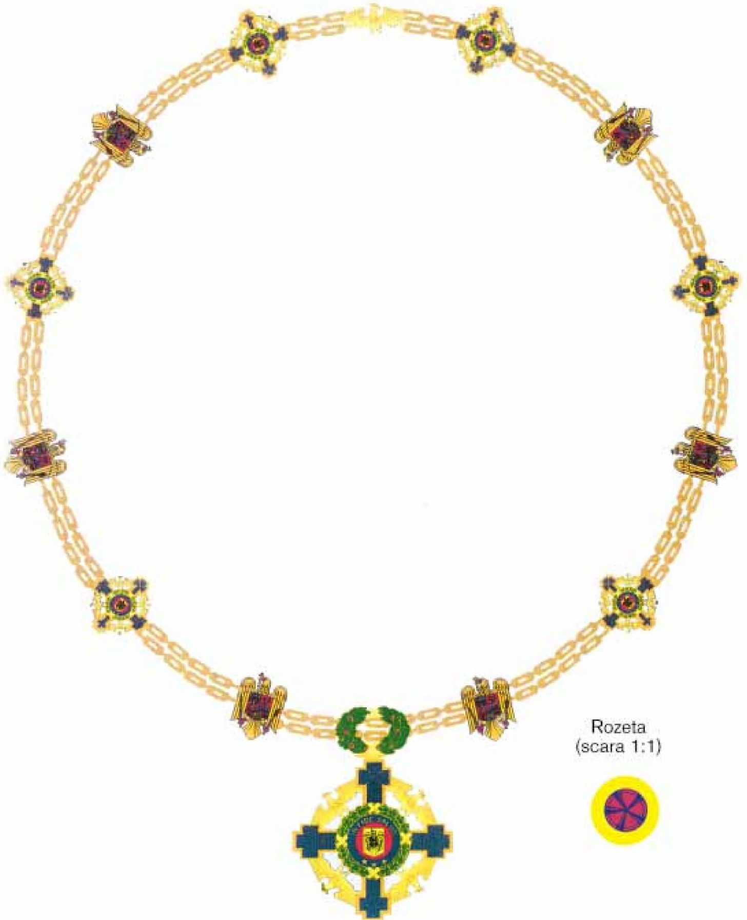
Rozeta (scara 1:1)