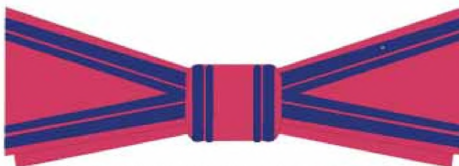
Fundă (papion) doamne cavaler